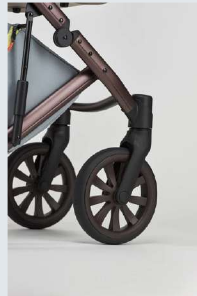
Ruedas sin aire