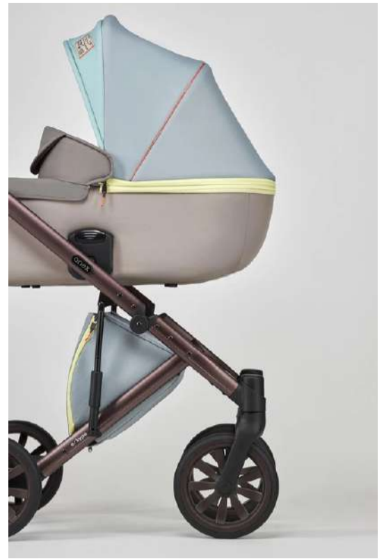
Colores inspirados en la naturaleza