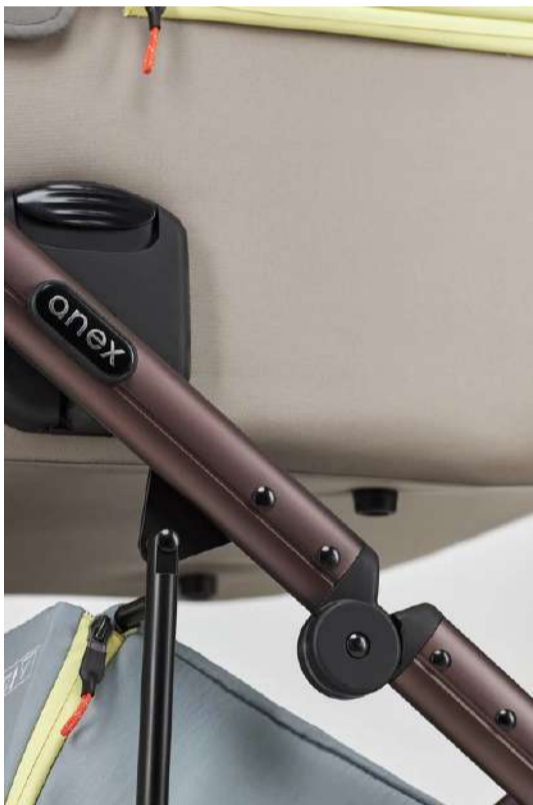
Chasis de un color único