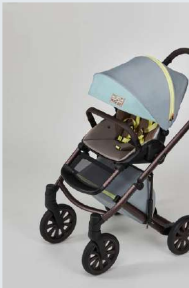
Silla de paseo