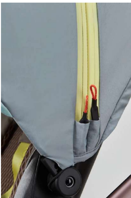
Tiradores de goma brillante en cremalleras