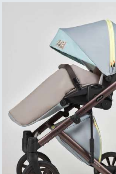
Cubrepies para la silla de paseo