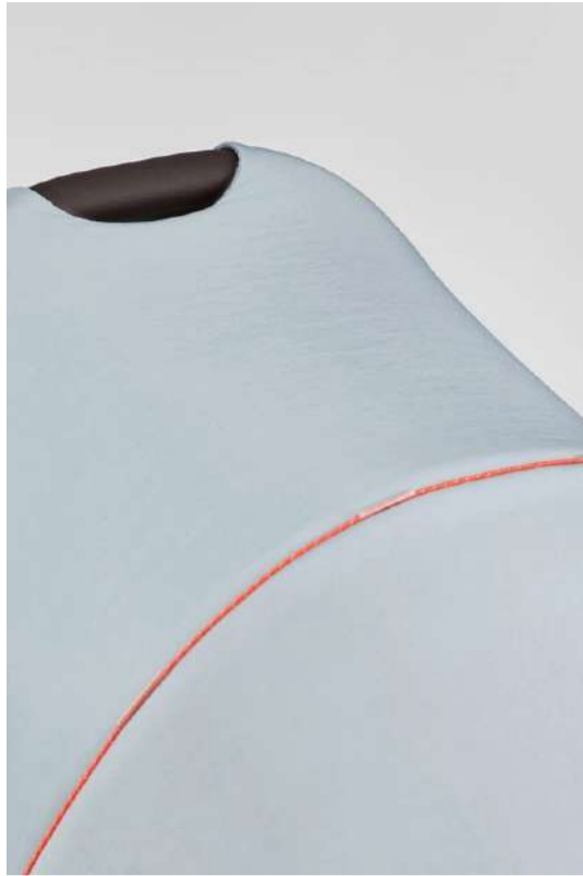
Tejido con efecto arrugado

“El diseño del cochecito de paseo no tiene que ver con un único material específico, sino con muchos elementos que se unen para crear la mejor experiencia para el niño y sus padres”.