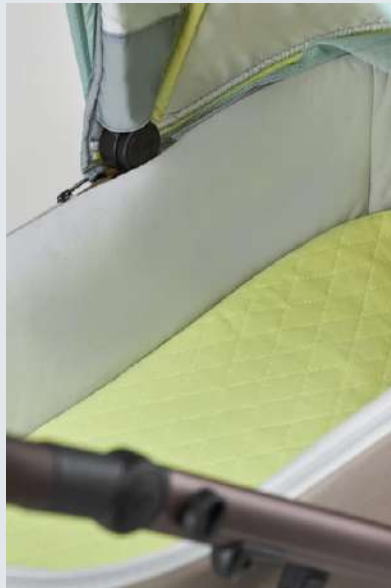
Capazo con colchón