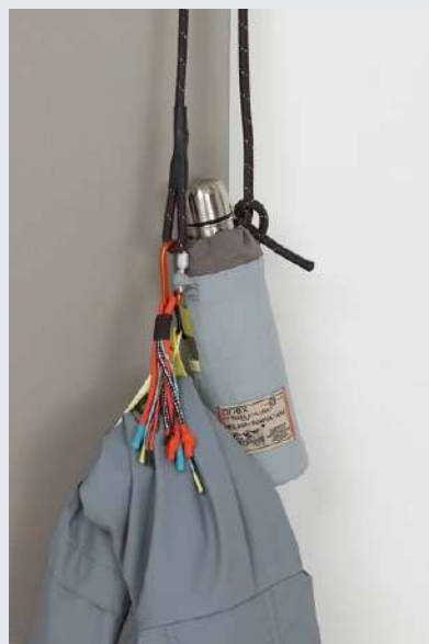
Botella ecológica con funda