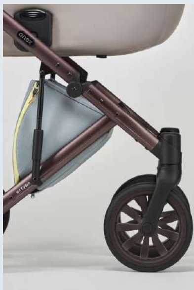
Cesta para el chasis